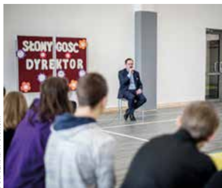
Fot. szkoła w Stonem