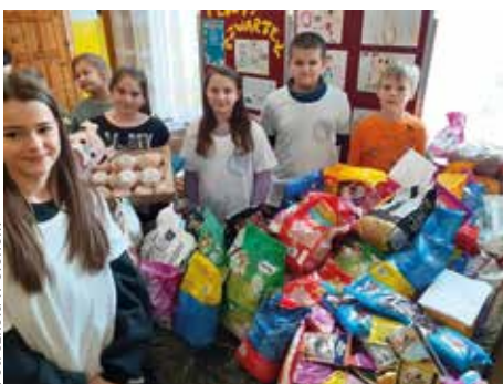
Fot. szkoła w Słonem