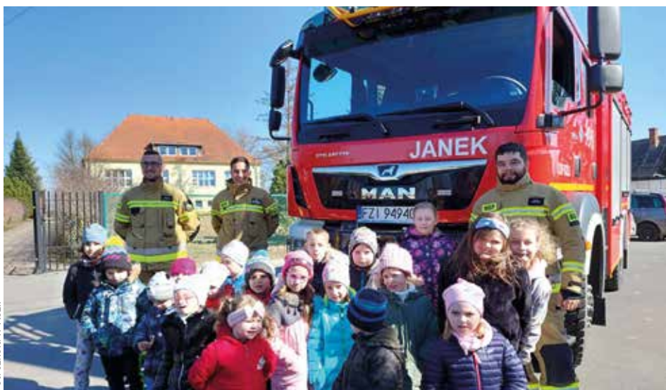
Fot. szkoła w Koźli