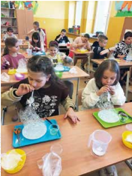
Fot. szkoła w Słonem