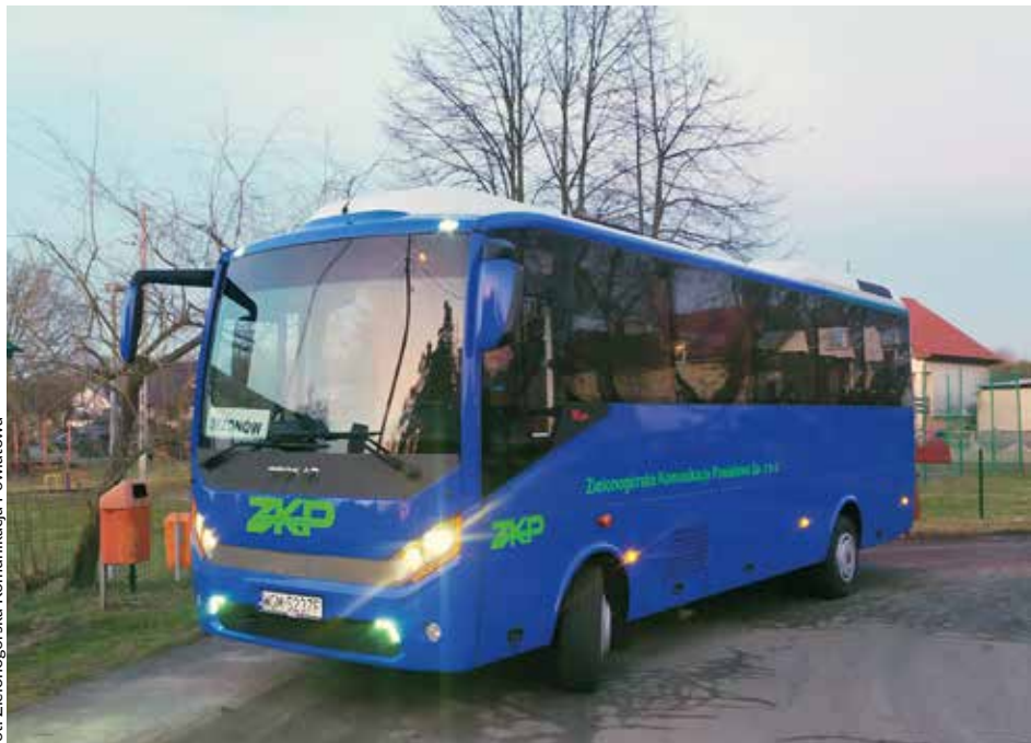
fol. Zielonogórska Komunikacja Powiatowa